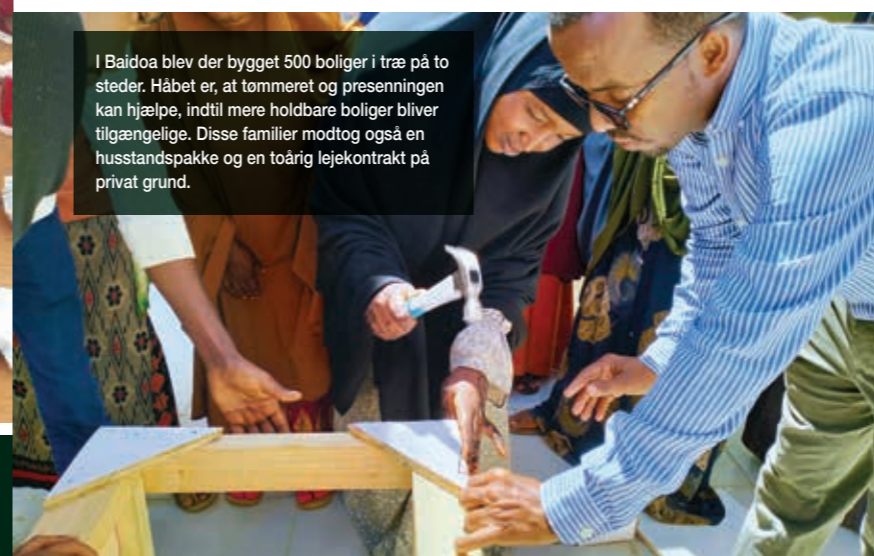
I Baidoa blev der bygget 500 boliger i træ på to steder. Håbet er, at tømreret og presenningen kan hjælpe, indtil mere holdbare boliger bliver tilgængelige. Disse familier modtog også en husstandspakke og en toårig lejekontrakt på privat grund.