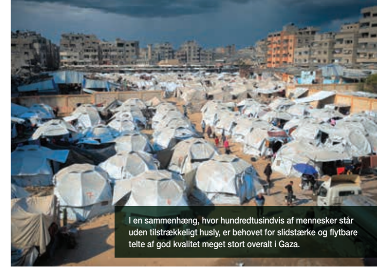
I en sammenhæng, hvor hundredtusindvis af mennesker står uden tilstrækkeligt husly, er behovet for slidstærke og flytbare telte af god kvalitet meget stort overalt i Gaza.

“Den nødhjælp, vi modtager igennem ShelterBox og SDF, udgør et håb, som gør vores liv bedre og gør det muligt for os at imødegå de udfordringer, vi står over for.”