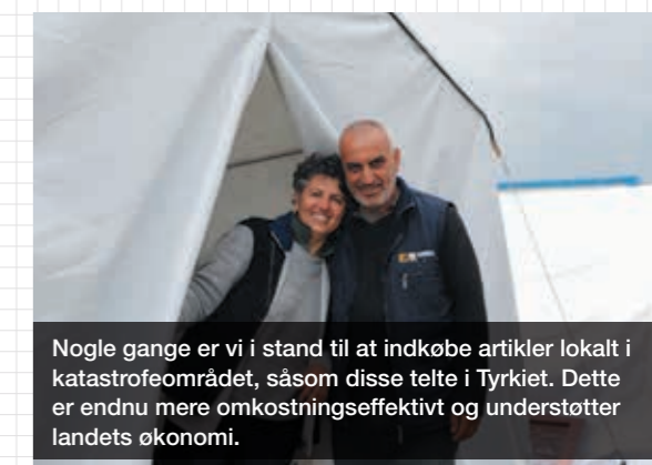
Nogle gange er vi i stand til at indkøbe artikler lokalt i katastrofeområdet, såsom disse telte i Tyrkiet. Dette er endnu mere omkostningseffektivt og understøtter landets økonomi.

Placeringen af vores globale lagre samt fastsættelse af mållagerniveauer er dynamiske faktorer, som kan justeres vha. skiftende leverandøraftaler, skiftende lokationskrav og nye strategiske partnerskaber.