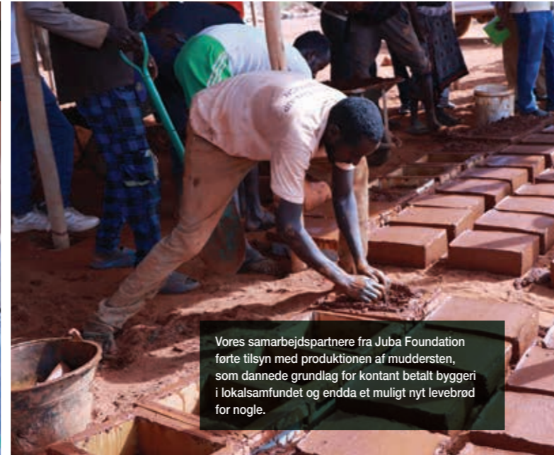
Vores samarbejdspartnere fra Juba Foundation førte tilsyn med produktionen af muddersten, som dannede grundlag for kontant betalt byggeri i lokalsamfundet og endda et muligt nyt levebrød for nogle.

SAMMEN MED VORES SAMARBEJDSPARTNER, JUBA FOUNDATION, HJALP PROJEKT 2 MERE END 2.300 SÅRBARE FAMILIER, DER VAR RAMT AF TØRKE, OVERSVØMMELSE ELLER KONFLIKT, I TO FASER, MED: