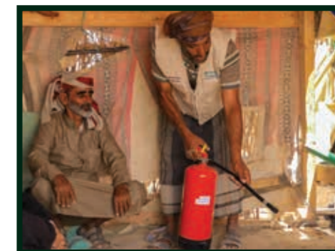
Vores samarbejdspartner, BCHR, demonstrerer brugen af ildslukkere i Yemen.

I april 2022 foreslog vores partner i Yemen, BCHR, at vi gjorde brandslukkere til en del vores nødhjælp. Brandudbrud var almindelige i lejrene, og flere mennesker var omkommet. Pulverbrandslukkere blev indkøbt lokalt af vores partnere, og der blev givet undervisning i lokalsamfundene i, hvordan de skulle bruges. Vi fortsætter med at uddele ildslukkere som del af vores nødhjælp i Yemen.