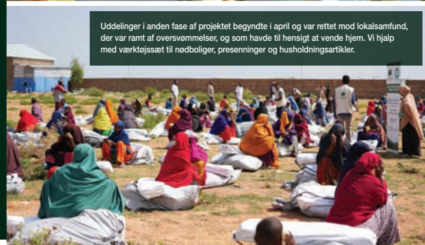
Uddelinger i anden fase af projektet begyndte i april og var rettet mod lokalsamfund, der var ramt af oversvømmelser, og som havde til hensigt at vende hjem. Vi hjalp med værktøjssæt til nødboliger, presenninger og husholdningsartikler.

Årtier med konflikt, sygdomsudbrud, udbredt fattigdom og klimachok har ødelagt befolkningen i Somalia. Efter at have oplevet den værste tørke i fire årtier mellem 2020-2023 blev befolkningen ramt af en oversvømmelse i store dele af det centrale og sydlige Somalia i 2023 og 2024. Det var en oversvømmelse, der kun sker en gang hvert århundrede – og som blev tilskrevet El Niño. Sæsonudsving med tørre og våde forhold er blevet mere ekstreme og giver Somalia meget lidt tid til at komme sig ind mellem årstiderne. 2,9 millioner mennesker er blevet fordrevet i 2023 med i alt 6,9 millioner mennesker i nød over hele landet.