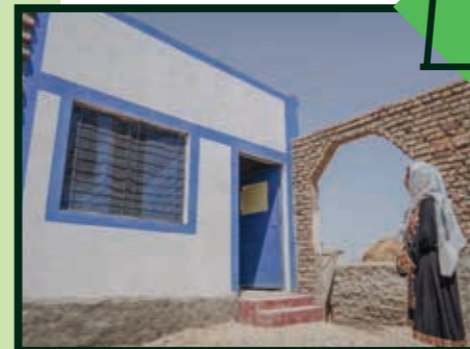
Efter oversvømmelserne i Pakistan i 2023 modtog familier materialer til at bygge mere holdbare boliger, herunder lokal kalksten, som er kendt for sine vandafvisende egenskaber.

Disse boligpakker omfatter materialer til at bygge boliger, der er afpasset behovene hos mennesker, der sandsynligvis vil være fordrevet i mere end et år. Boligerne er designet til at holde i op til fem år, hvor folk har ret til at forblive på stedet. Pakken kan omfatte strukturelle materialer som f.eks. tommer til hovedstrukturen og derudover cement, sand og/eller bølgeplader til tagdækning eller døre. Vi afholder også normalt kurser i lokalsamfundet for at sikre, at boligerne bygges til en specificeret standard og kan holde.