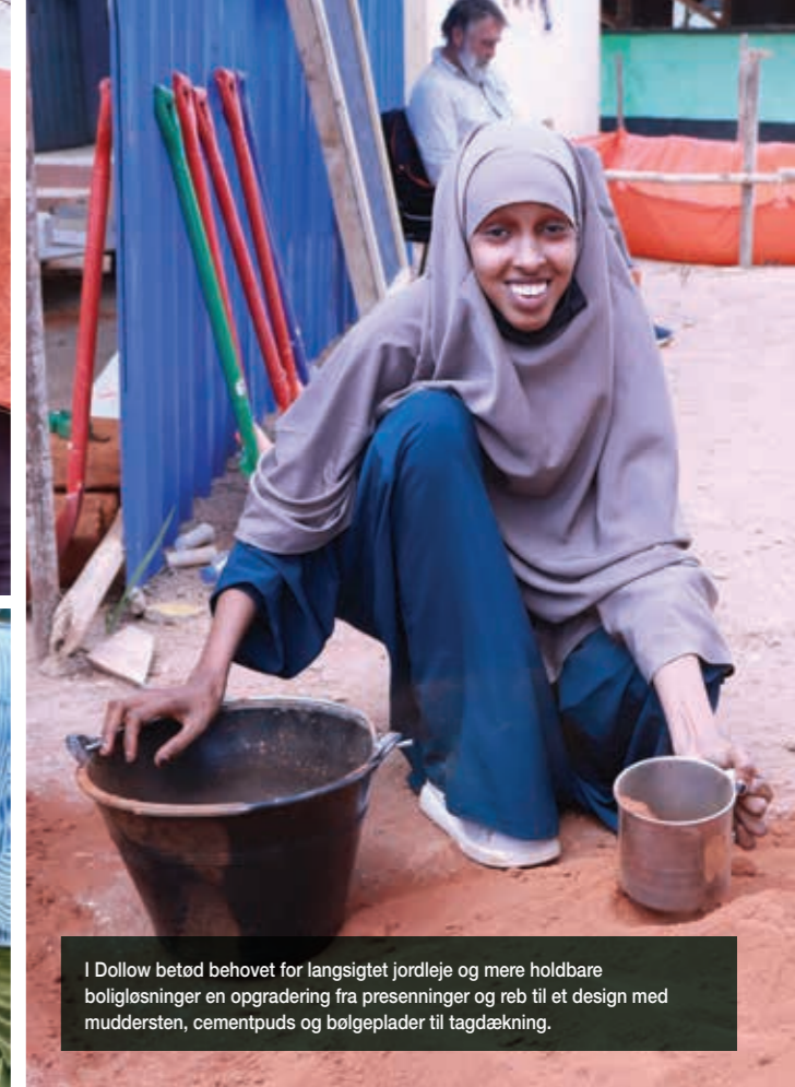
I Dollow betød behovet for langsigtet jordleje og mere holdbare boligløsninger en opgradering fra presenninger og reb til et design med muddersten, cementpuds og bølgeplader til tagdækning.