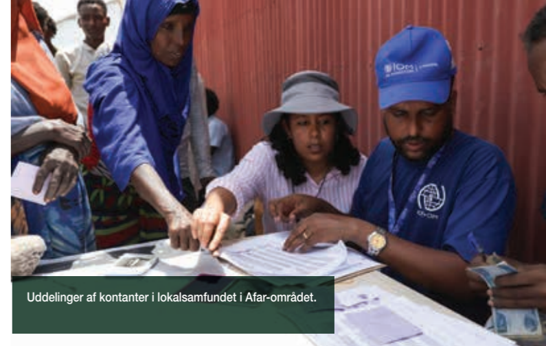
Uddelinger af kontanter i lokalsamfundet i Afar-området.