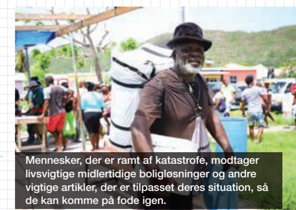
Mennesker, der er ramt af katastrofe, modtager livsvigtige midlertidige boligløsninger og andre vigtige artikler, der er tilpasset deres situation, så de kan komme på fode igen.