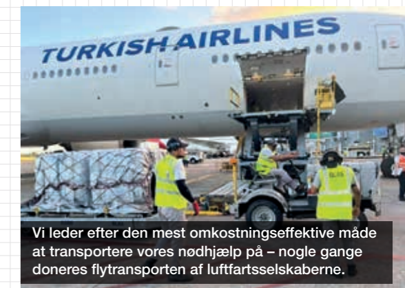
Vi leder efter den mest omkostningseffektive måde at transportere vores nødhjælp på – nogle gange doneres flytransporten af luftfartsselskaberne.