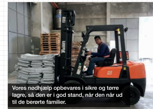
Vores nødhjælp opbevares i sikre og tørre lagre, så den er i god stand, når den når ud til de berørte familier.