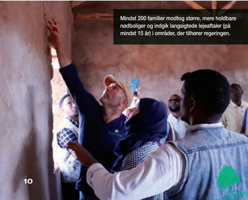
Mindst 200 familier modtog større, mere holdbare nødboliger og indgik langsigtede lejeaftaler (på mindst 15 år) i områder, der tilhører regeringen.