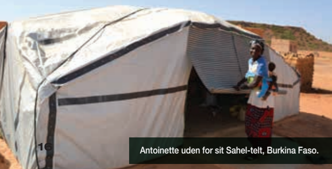
Antoinette uden for sit Sahel-telt, Burkina Faso.

I samarbejde med HELP sigter vi på at hjælpe mindst 1.000 familier, der for nylig er fordrevne af konflikten, med nødboliger og husholdningsartikler. Projektet fokuserer på konstruktionen af Sahel-telte, som har en betonbase, der beskytter mod oversvømmelser og forbedrer hygiejnen. Vi har også hjulpet 400 familier med myggenet og solcellelys fra vores forudplacerede lager i Ghana.