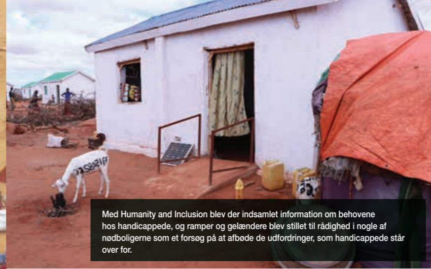
Med Humanity and Inclusion blev der indsamlet information om behovene hos handicappede, og ramper og gelændere blev stillet til rådighed i nogle af nødboligerne som et forsøg på at afbøde de udfordringer, som handicappede står over for.

Kurser i jordleje er blevet afholdt i Baidoa og Dollow for at sikre, at folk er opmærksomme på deres rettigheder og de skridt, de kan tage, hvis der er problemer.