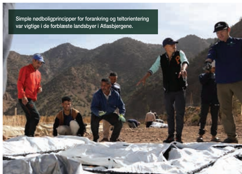
Simple nødboligprincipper for forankring og teltorientering var vigtige i de forblæste landsbyer i Atlasbjergene.

En af de enkleste former for nødbolig, vi tilbyder, er telte, der ofte bruges i katastrofesituationer som jordskælv. I Marokko blev områderne til teltene nivelleret for at sikre tilstrækkelig dræning. Medlemmer af lokalsamfundet blev oplært i at opsætte teltene og rådgivet om korrekt placering for at modstå vintervinden, der blæser gennem lejren, og sikre god adgang til sanitære faciliteter.