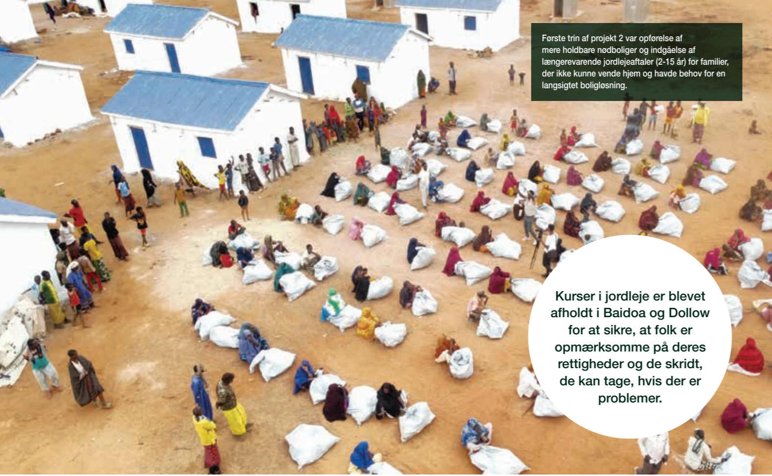
Første trin af projekt 2 var opførelse af mere holdbare nødboliger og indgåelse af længerevarende jordlejeaftaler (2-15 år) for familier, der ikke kunne vende hjem og havde behov for en langsigtet boligløsning.

Kurser i jordleje er blevet afholdt i Baidoa og Dollow for at sikre, at folk er opmærksomme på deres rettigheder og de skridt, de kan tage, hvis der er problemer.