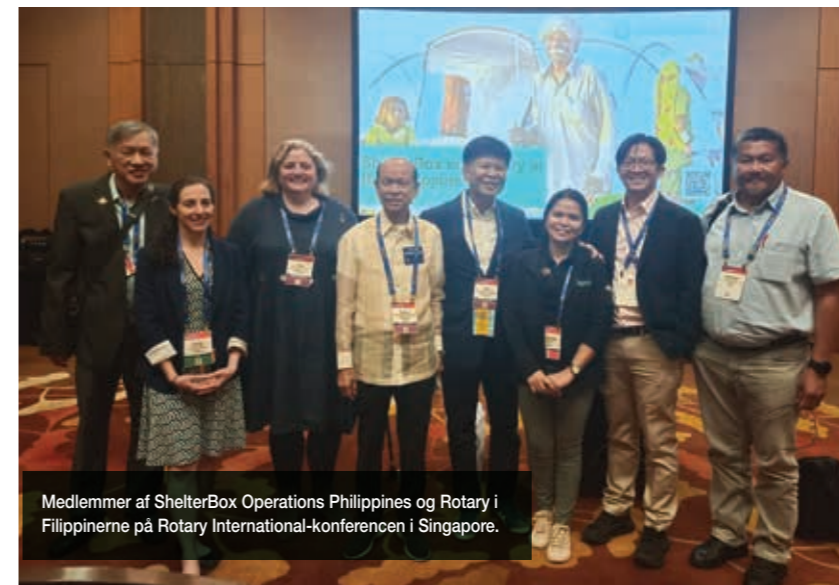
Medlemmer af ShelterBox Operations Philippines og Rotary i Filippinerne på Rotary International-konferencen i Singapore.

I maj rejste et multinationalt ShelterBox-team til Rotary International-konferencen i Singapore for at fejre vores officielle partnerskab med det globale Rotary i House of Friendship. Med en udvidet standplads på hovedmessen kunne ShelterBox-teamet møde nye og gamle supportere, forklare udviklingen af vores nødhjælp og demonstrere styrken i samarbejdet.