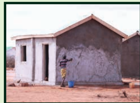
En længerevarende nødbolig med betongulv i Somalia.

Nivellering af jorden til opsætning af telte udføres normalt ved hjælp af cementblokke, grus og støbt cement for at gøre boligerne mere holdbare og øge beskyttelsen mod oversvømmelser og ekstreme vejrforhold.