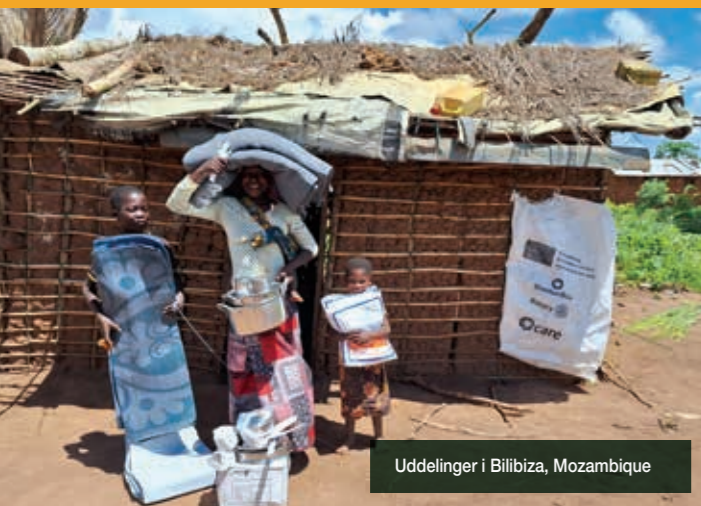
Uddelinger i Bilbiza, Mozambique

Ikke mindre end ni af verdens ti mest oversete kriser er i Afrika (Norsk Flygtningehjælp, 2023).