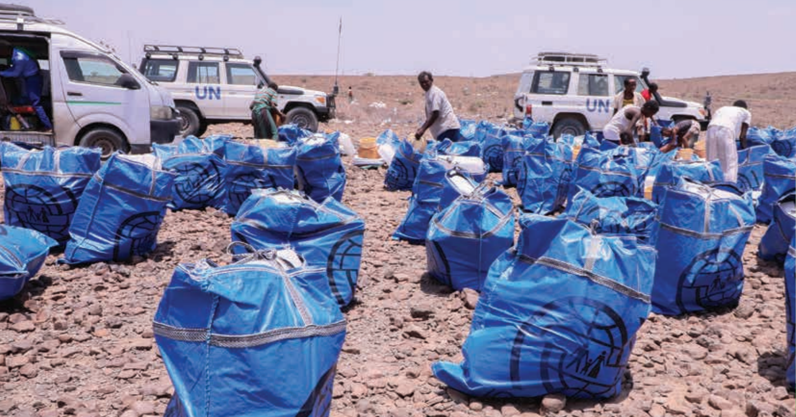
Uddelinger af nødhjælp i Afar-regionen, august 2024.

De komplicerede årsager til fordrivelse i Etiopien kombineret med den humanitære situation nødsager, at vi er tilpasningsdygtige og at vi skræddersyr vores nødhjælp til at imødekomme behovene i de forskellige lokalsamfund. Vi justerede vores nødhjælpspakker med husholdningsartikler efter de forskellige forhold i lavland og højland. Vi uddelte termiske tæpper i højlandet og sengetøj i lavlandsområderne, hvor der er varmere. 15 % af pakkerne blev tilpasset behovene hos handicappede og omfattede madrasser for at sikre ekstra komfort. Vi tilføjede også flere vandbeholdere og presenninger. 30 % af de mest sårbare familier modtog også kontanter på USD 50, så de kunne købe yderligere materialer til at bygge deres nødboliger og betale for arbejdskraft.