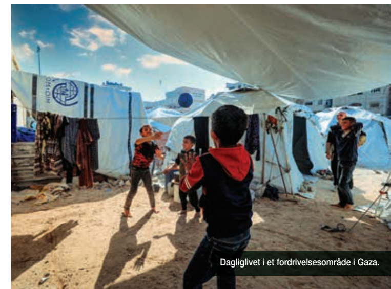
Dagliglivet i et fordrivelsesområde i Gaza.