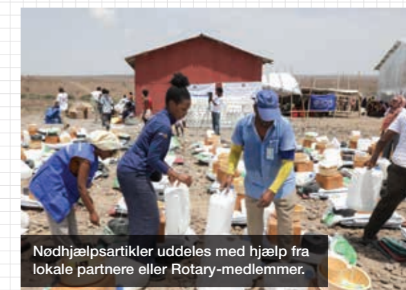
Nødhjælpsartikler uddeles med hjælp fra lokale partnere eller Rotary-medlemmer.